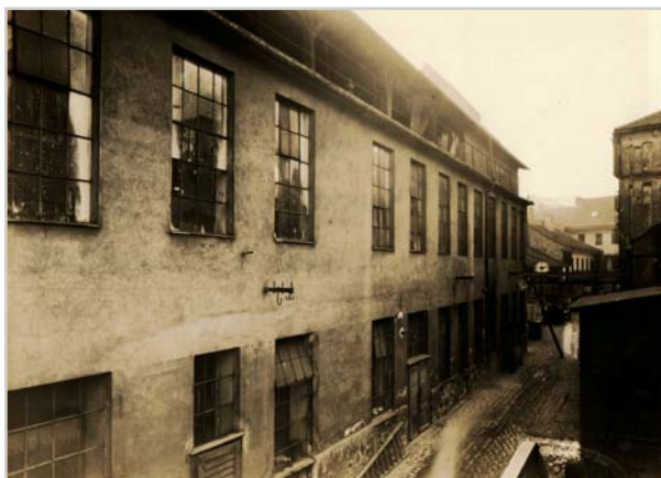
Tovární areál na Cejlu 72 v Brně krátce před znárodněním v roce 1948. Firma tehdy nesla počestný název Mořic Fuhrmann