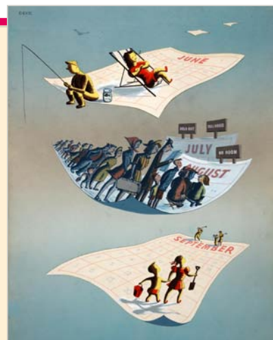
Poválečný plakát Dorrit Dekk pro Centrální úřad pro informace propagující rozložení dovolené na více měsíců

Po své emigraci se vdala za vědce Leonarda Klatzowa, který krátce na to nečekaně zemřel na srdeční slabost. Dorothea ale v Británii již zůstala. Po válce se začala věnovat komerčnímu designu pod uměleckým jménem Dorrit Dekk, které si zvolila podle svých iniciál Dorothea Karoline Klatzow. Proslavila se svými plakáty pro britský Centrální úřad pro informace, pro který zpracovávala hesla jako „ Kýchání a kašel šíří nemoci “