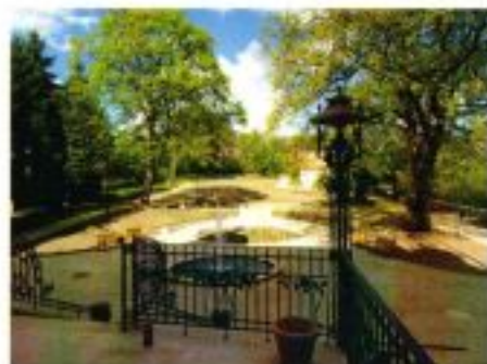
Pohled do zahrady Vily Löw-Beer.