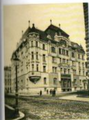
Budova Obchodní a živnostenské komory (dnes Divadelní fakulta) v Brně.