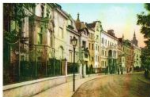
Pohled do ulice Sadová (dnes Drobného) v Brně, pohlednicí ok. AMB, inv. č. 10A-5