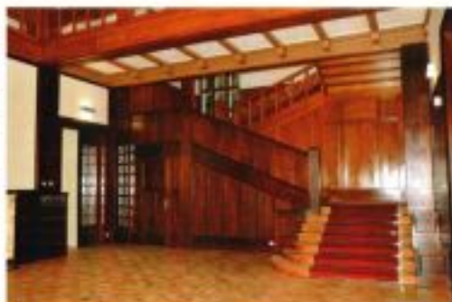
Schodišťová hala Vily Löw-Beer. Stav po rekonstrukci v roce 2014.