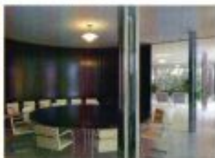
Zahradní průčelí vily Tugendhat. Hlavní obytný prostor vily Tugendhat.

potřeby tajné státní policie (gestapa). Po roce 1945 byla vila znárodněna a v roce 1954 se stala majetkem československého státu. V letech 1962–2012 zde sídlili domov mládeže. V současnosti je vila v majetku Jihomoravského kraje a ve správě Muzea Brněnska. V letech 2013 a 2014 prošla náročnou památkovou obnovou a v roce 2015 zde bude umístěna muzejní expozice s názvem Svět brněnské buržoazie mezi Löw-Beer a Tugendhat. 33