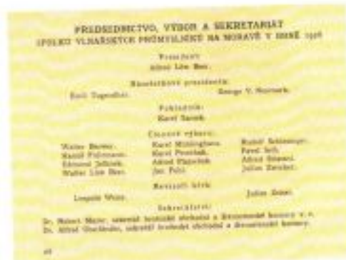
Předsednictvo Spolku vlnářských průmyslníků na Moravě v Brně 1928. Převzato z Vlček, Bohamě Textilní průmysl brněnský. Praha 1928, s. 26.

Největší závod firmy představovala, vedle filiálek v Jimramově 15 a v Brně, továrna ve Svitávce. Příchod rodiny Löw-Beerů do Svitávky znamenal pro obec několik zásadních změn: přechod od převážně zemědělské produkce k průmyslové výrobě, zvýšení počtu obyvatel (z 672 osob v roce 1834 na 2 268 osob v roce 1930) a v neposlední řadě urbanistické změny. První tovární provoz, tzv. Starou fabriku (dnes obytný dům na Hybešově ul. čp. 40), vybudoval již Moses Löw-Beer. K roku 1882 byla vybudována nová tovární hala, která znamenala začátek výstavby celého komplexu továrních budov východně od historického jádra obce. V roce 1904 byl přistavěn soubor hal se šedovými střechami, a to firmou Ed. Ast & Co. Postupně přibývaly další přízemní a patrové provozní budovy. K roku 1906 se zde uvádí přádelna mykané příze, tkalcovna vlněného zboží se 170 stavy, výroba umělé vlny, barvírna, tiskárna a apretura. 16 Na počátku 20. století ve svitávecké továrně pracovalo až 1 600 zaměstnanců. Löw-Beerové zde