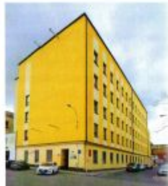
Dnešní stav budovy na Čechyňské ul. č. 14 v Brně, v r. 192 byla továrna Mosese Löw-Beer.

se stal jedním z největších a nejmoderněji vybavených závodů v Evropě. Místo na samém pomezí mezi Uherskem, Rakouskem a Moravou bylo vybráno zřejmě i s ohledem na dobrou dopravní dostupnost. Nedalekým městečkem Angern an der March totiž od roku 1839 vedla trať Severní dráhy Ferdinandovy, takže stačilo cukr dopravit koněspěznými vozy do Angern a odtud po železnici do Vídně a dále do Evropy. 5