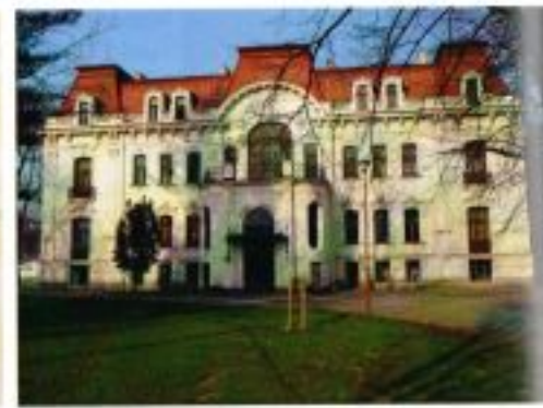
Přehled tzv. velké Löw-Beerovy vily, Svitávka.

nejen firemní haly, obytné domy, školská a zdravotnická zařízení, ale i významné veřejné stavby jako kostel či radnice, a to vše v jednotném "firemním stylu" s užitím typických červených režných cihel. 23 Snad ještě známějším příkladem je výstavba novodobého Zlína podnikatelem Tomášem Baťou (1876–1932), který si zde v roce 1894 založil obuvnickou dílnu. T. Baťa vytvořil z provinčního zemědělského maloměsta moderní město pro "50 000 obyvatel", ve kterém se uplatnila kvalitní funkcionalistická architektura předních světových tvůrců, např. architekta Le Corbusiera. Nechal vystavět tovární budovy, obydlí pro dělníky, ale také obchodní a dopravní infrastrukturu, služby, místa kulturního a sportovního využití. 24