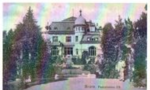
Zahradní průčelí Vily Löw-Beer, 1911.