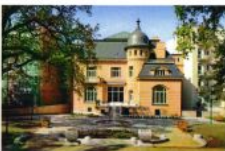
Dnešní stav zahradního průčelí Vily Löw-Beer.

nách a stropěch v interiérech včetně truhlářských konstrukcí. Secesní rostlinné motivy jsou také na keramické dlažbě a litinovém zábradlí schodiště. Po Fuhrmannově smrti prodal v srpnu 1913 jeho dědicové vilu za 290 tisíc korun právě Alfredu Löw-Beerovi. Nový majitel nechal ve třicátých letech dům částečně stavebně upravit (především prostor centrální schodišťové haly). Autorem úprav byl opět dvorní architekt rodiny Löw-Beerů Baumfeld. V roce 1940 zabavili vilu Němci pro