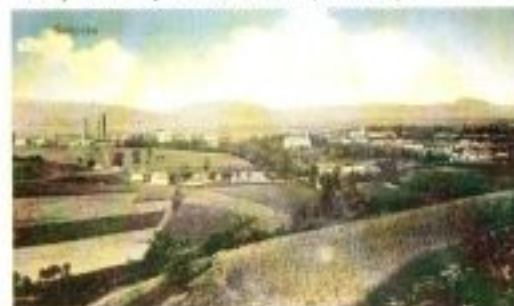
Pohled na Svitávku (vlevo tovární budovy firmy Moses Löw-Beer), pohlednice.

pro ně postavili dvě tzv. kasina (jidelny a společenské místnosti), úřednické a dělnické domy a pro jejich děti zřídili mateřskou školku s bezplatným stravováním. V roce 1910 nechala firma Moses Löw-Beer zpracovat projekt dělnického sídliště jihovýchodně od městečka. 17 Zdravotní a sociální program byl naplňován zřízením dělnické podporovací pokladny, podporovací pokladny pro vdovy a sirotky a nemocniční pokladny. 18 Paternalistický přístup k zaměstnancům se projevoval