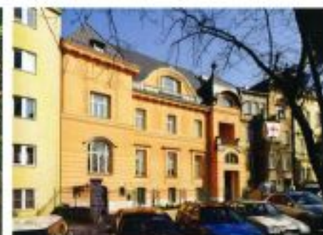
Dnešní stav uličního průčelí Vily Löw-Beer (Fuhrmannovy vily) na Drobného ul. č. 22.