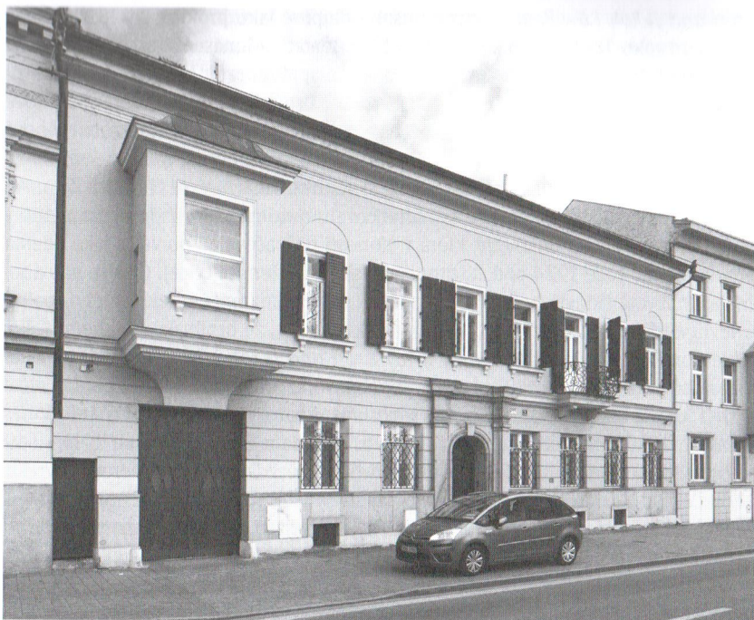
Dům č. o. 104, současný stav.

dřevěné okenice. Stavbu zakončuje korunní římsa, která nese sedlovou střechu. Dům si přes množství detailů uchovává střízlivé neoklasicistní formy.