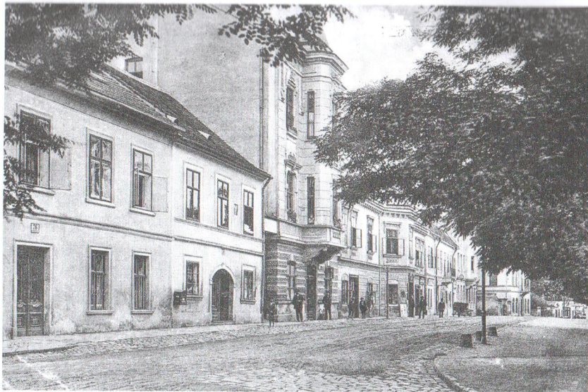
Reprezentační zástavba na ulici Hlinky na počátku 20. století, už tehdy byla ulice lemována stromořadím; na snímku je i dům č. o. 72. (historická pohlednice)