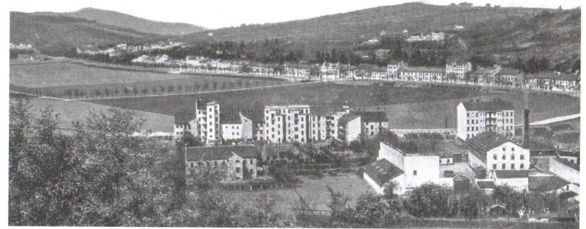
Ulice Hlinky v roce 1912.

(historická pohlednice, publikováno s laskavým svolením Nakladatelství Josef Filip)