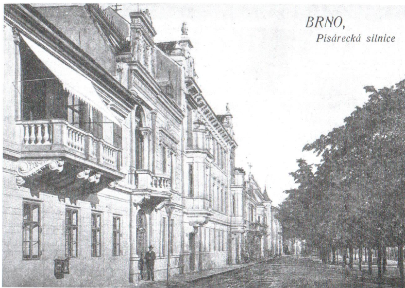
BRNO, Pisárská silnice