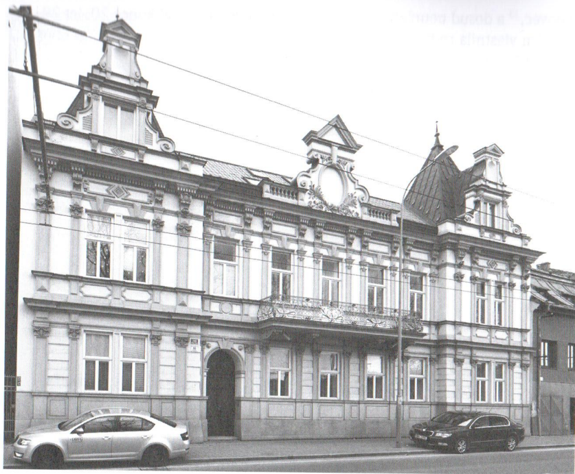
Dům č. o. 86 na ulici Hlinky, současný stav.

pouze vstup situovaný vlevo od centrální osy. Fasádu nad obložení soklu člení nepravá pásová bosáž v přízemí a pilastry v obou patrech. K hladce osazeným oknům se na průběžných podokenních římsách připojují obdélné parapetní výplně, v patře je navíc v horní části vložen klenák. Tři střední osy v patře doplňuje balkon s jemně tepaným zábradlím. Kompozici průčelí gradují postranní rizality zakončené atikovými bohatě formovanými štíty, jakož i nad balkonem centrální atikový štít s vepsaným slepým oválným otvorem. Vila postavená ve stylu pozdního historismu, s četnými eklektickými detaily, svým subtilním pojetím odpovídá charakteru francouzské renesance. Z katastrálních map města Brna ze začátku 20. století vyplývá, že rozsáhlou zahradu si Karpelesovi upravili na park.