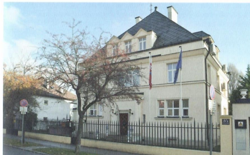
Neoklasicistní vila na Blasasstraße 34 ve Vídni, současný stav.

předešlé banky. Fasáda se však zdá být ještě umírněnější, než jsme u Gotthilfa s Neumannem zvyklí. Důvodem bylo vměšování konzervativní posudkové umělecké komise města, která dbala na „historický kontext“ okolních budov. 31 Později se oba podíleli ještě na návrhu jedné banky, Eskomptní banky Na Příkopě v Praze (Celetná 33, 1924), spolu s Karlem Jarayem, Josefem Sakařem a Rudolfem Hildebrandem. 32