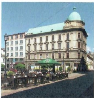
Činžovní dům v Bílsku (náměstí Wolnošci 10, 1904), současný stav.

Neumannovo specifické školení při projektování a výstavbě divadelních a lázeňských budov našlo uplatnění v interiéru Fuhrmannovy vily, a to včetně jejího technického zázemí. Centrální schodišťovou halu vily zalévá světlo ze stropního světlíku, do nějž proniká skrze celoprosklenou nízskou jehlancovou střechu. Horní