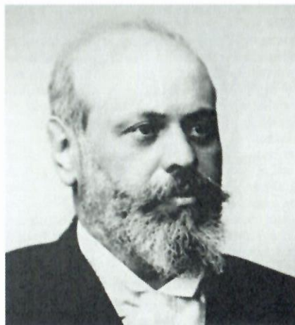
Architekt Alexander Neumann (1861–1947), kolem roku 1911.

Vídně se s jeho bankami a činžovnými domy setkáme na každém kroku a najdeme je i v dalších velkých městech bývalé rakousko-uherské monarchie (Štýrský Hradec, Bílsko-Bělá, Lvov) i mimo ni (Sofie, Istanbul). V rakouských příručkách a průvodcích se tak jméno Alexandra Neumanna objevuje poměrně často, 4 avšak reprezentativní monografické zpracování a zhodnocení jeho odkazu chybí. Komplexněji se s ním lze seznámit pouze v on-line Encyklopedii architektů, Vídeň 1770–1945 Centra architektury ve Vídni. 5 Díky objevu Neumannovy pozůstalosti na Novém Zélandu v roce 1999, 6 se jeho dílem nejnověji zabývali dva australská badatelé: Fiona McAlpine a Andrew Leach se v analytické stati zaměřili na tři z jeho bankovních budov (v Praze, Vídni a Štýrském Hradci). 7