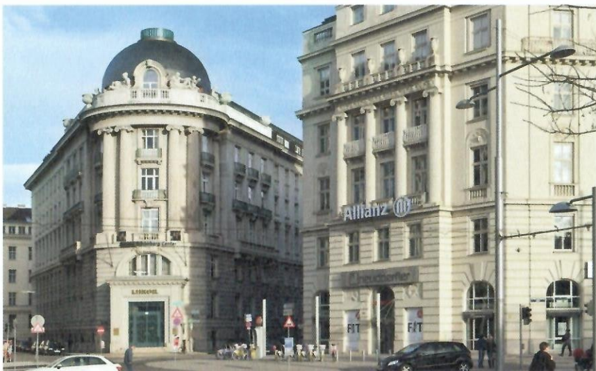
Palác Fanto vlevo, skupina nájemních domů vpravo, Schwarzenbergplatz, Vídeň, současný stav.

V roce 1910 Neumann vstoupil do vídeňského Künstlerhausu (Domu umělců), v němž setrval až do vynucené rezignace v roce 1938. 27 V tomto období vznikla ve Vídni celá plejáda významných komerčních staveb architektonického dua Gotthilf–Neumann, především pojišťoven a bank. Zakázky se jim dařilo získávat i v období všeobecné stagnace během první světové války, již nebyl jejich hlavní objednavatel, bankovní sektor, tolik zasažen. 28 Mezi jinými vyzdvihneme kancelářskou budovu pojišťovny Anker (Hoher Markt 10–12, 1913), u níž se opakuje koncept na tradici lpícího neoklasicistního exteriéru s racionálním dispozičním řešením, nebo další neoklasicistní budovu, Zemskou banku (Am Hof 2, 1913–1914) s portikem s dórskými sloupy. 29 Neměli bychom opomenout ani impozantní Palác Fanto (Schwarzenbergplatz 6, 1917–1918), jehož ostré nároží je koncipováno jako kruhová věž obklopená šesticí kanelovaných jónských sloupů, které vynáší balustrádu zdobenou sochami a vázami. 30