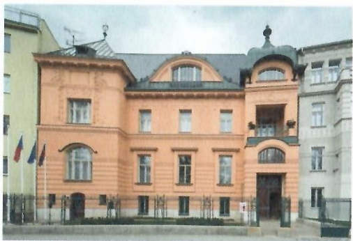
Fuhrmannova, později Lów-Beerova vila v Brně (Drobného 22, 1903–1904), uliční fasáda, současný stav.